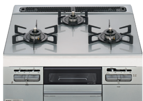
※バーナーキャップの色はブラックです。